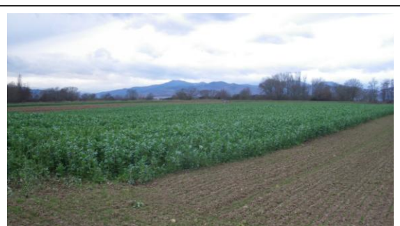
Culture de féverole en engrais vert