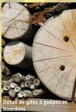
Détail de gîtes à guêpes et bourdons

En dehors, en amont ou en complément de la mise en place d'écotones spécifiques, l'installation de « nichoirs » ou « d'hôtels » à insectes est possible et même conseillée. Situés dans des milieux où leur nourriture abonde, ils pallient efficacement au manque de gîte.