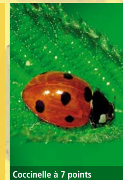
Coccinelle à 7 points