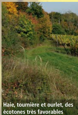
Haie, tournière et ourlet, des écotones très favorables