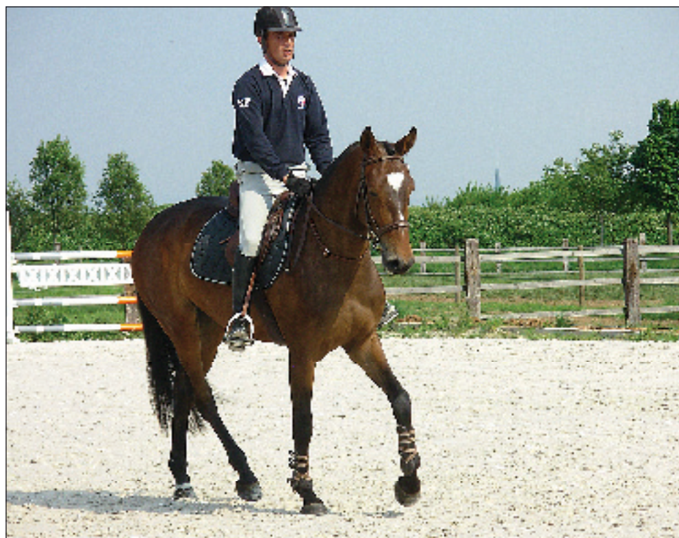
Le réseau référence compte 300 exploitations équestres en France.

Le Conseil des chevaux d'Alsace (Afca), en partenariat avec la Chambre régionale d'agriculture Alsace, l'institut de l'élevage et l'Institut français du cheval et de l'équitation, lance le réseau référence équin.